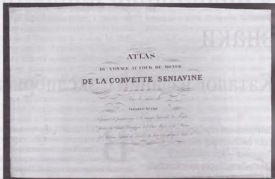
Титульный лист после реставрации

3 Русские географические атласы. XIX век: Сводный каталог: [В 2 вып.]: Вып. 1: 1807–1840 / М-